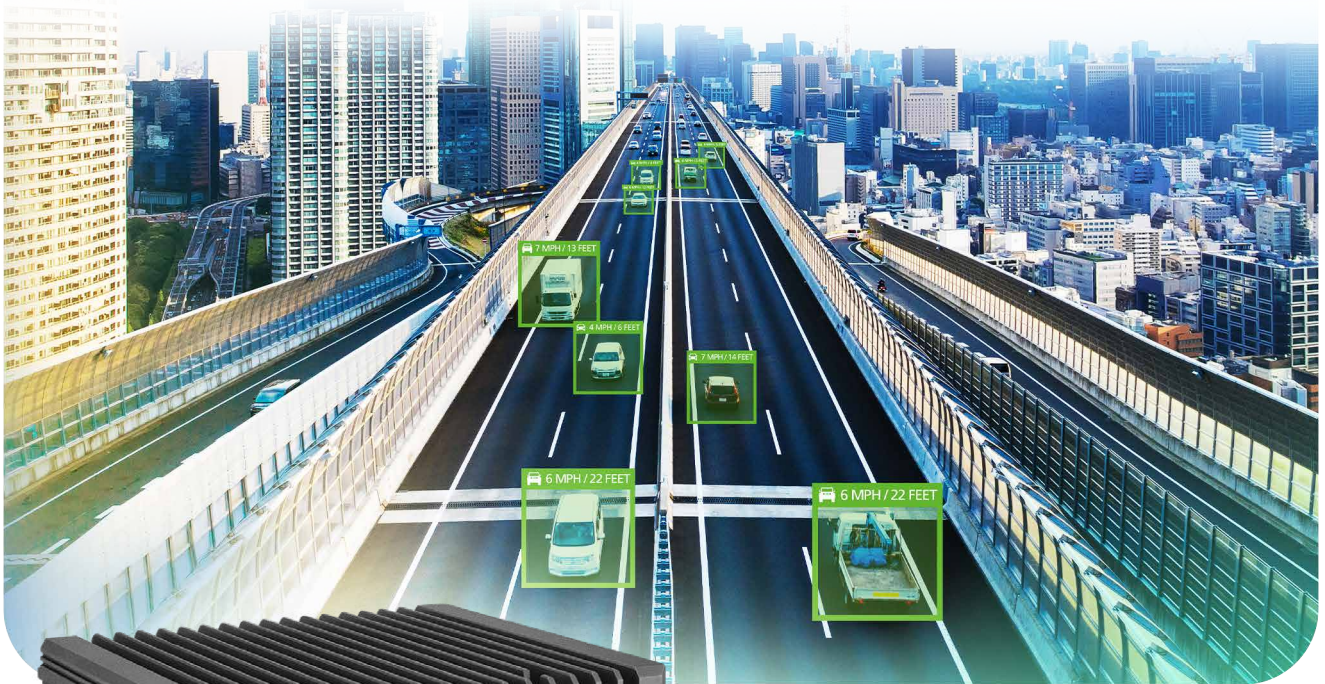
△ トラフィックビジョン

NVIDIA® Jetson Orin™ NX/Nano 搭載 手軽に導入可能な小型 AI コンピューティング